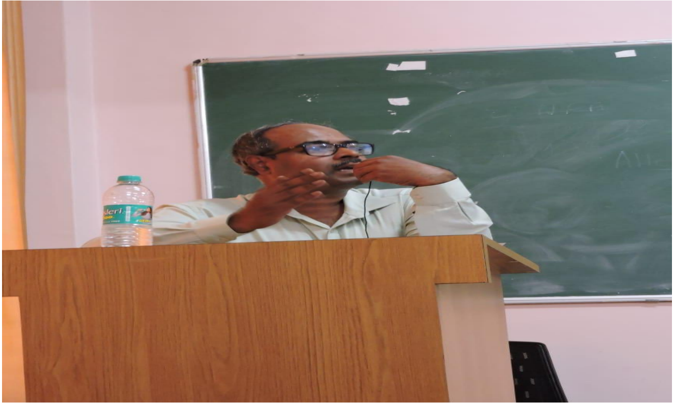
DISCUSSION WITH BCA STUDENTS