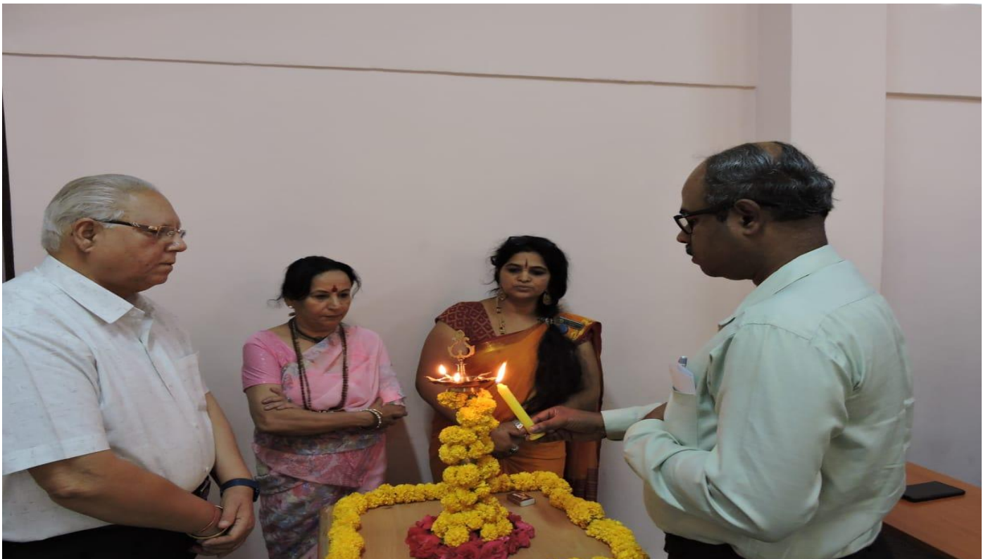
IN LIGHTING OF THE LAMP BY THE GUEST SPEAKER