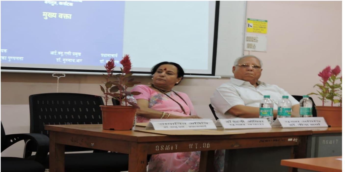
WELCOME OF THE GUEST BY OUR HINDI PARISHAD TEAM MEMBER