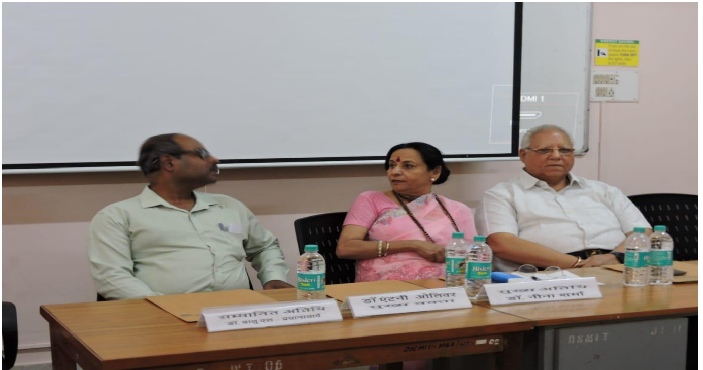
GUESTS OF THE EVENTS