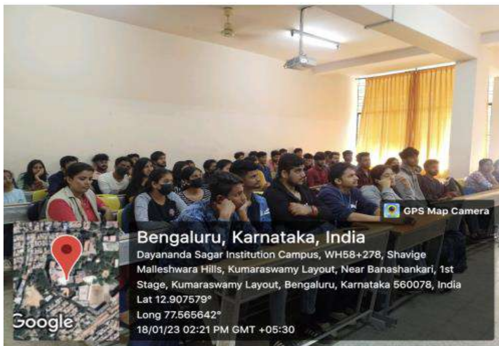
3. All 3 rd SEM Kannada Students